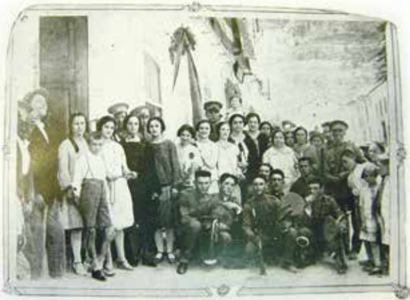
La primera biblioteca de 1894

La primera biblioteca que apareix documentada a Simat, es a l'any 1894 (el pròxim any complirem els 130 anys), quan es va publicar la notícia sobre la inauguració del Círculo Instructivo, a la plaça de la Constitució , i senyalen l'existència d'una biblioteca.