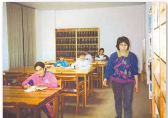
primer? biblioteca al primer pis 1991

La biblioteca, es va instal·lar al primer pis. La biblioteca, disposava d'una sala de lectura, un dipòsit i un despatx per a realitzar la gestió interna. A la planta baixa es trobava el centre mèdic. Però quan el centre mèdic, es va traslladar a l'Avinguda de la Vall d'Alto, i es va realitzar l'actual remodelació de l'edifici, a l'any 2011, la biblioteca va passar a la planta baixa, on es troba en l'actualitat. Durant el termini de temps que van durar les obres, a la Casa