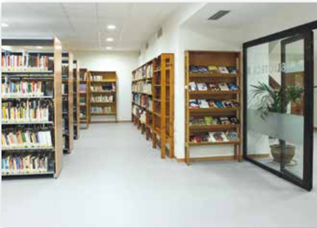
Actual biblioteca 2011

Hem parlat de l'edifici, dels documents i de la introducció de les noves tecnologies a la biblioteca, ara anem a parlar del personal.