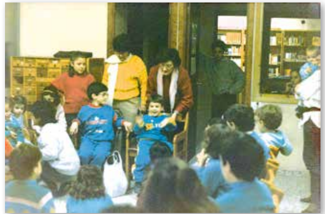
Activitats de foment lector a la biblioteca Avinguda Jaume I, en 1988

Es en aquest moment quan l'Ajuntament va llogar una planta baixa al carrer Jaume I, just enfront de l'actual bar Bicoca, per a ubicar la biblioteca. Ací es va mantindre fins que es van acabar les obres de la Casa de la Cultura, en 1989.